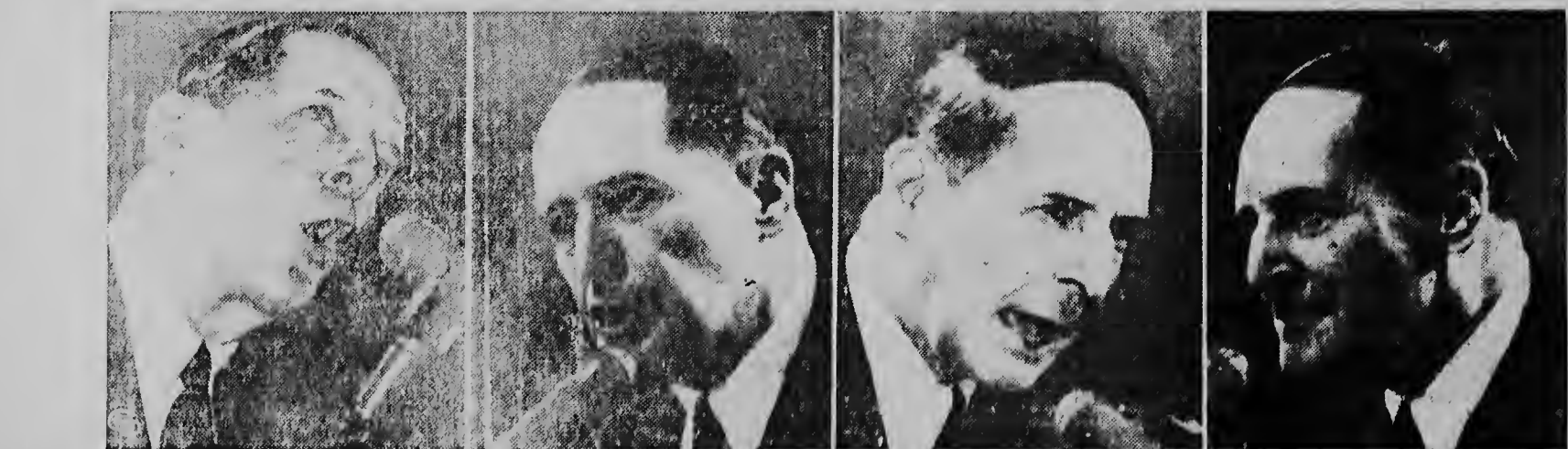
... MacArthur wilde in de politiek, hij sprak ... en sprak ... maar slaagde niet ...

De uitvoerders van de onder de wet op de atoomenergie vallende materialen zullen in de toekomst geresgeld worden bekend gemaakt.